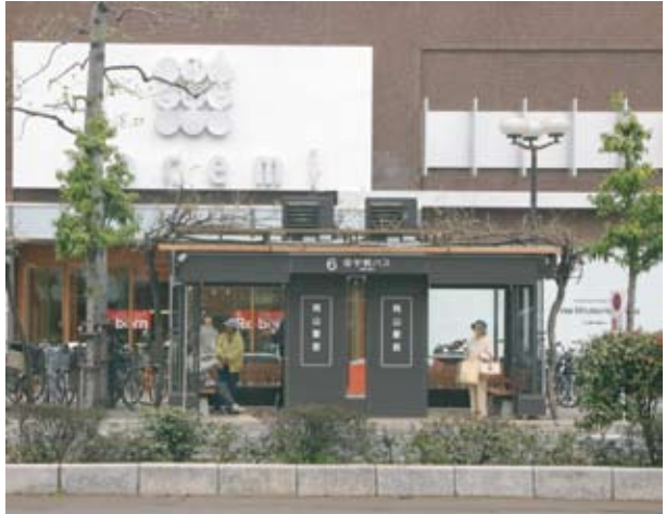
▶岡山駅前(ドレミ6番)の新設された待合室