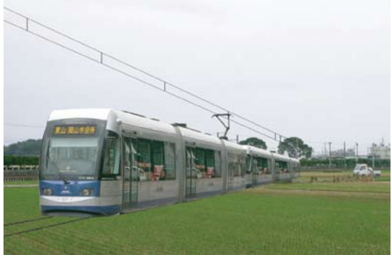
◀ 吉備線と岡山市内直通用に導入されたMOMOのイメージ図 近い将来このような風景が現実になるでしょう

※6両編成のMOMO＝ラッシュでもできる限り座れる様に、全長50m以上の巨大なMOMOが吉備線と岡山市内の直通用に導入される。