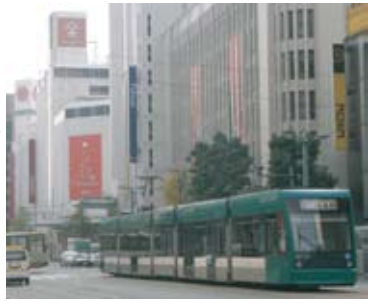
市内・郊外を直通する 広電の路面電車 観光にも通勤にも利便性が高い

■広島には、広島駅から都心を通り、観光名所である宮島の手前、「宮島口」の間、およそ20kmを1時間で結ぶ、直通路面電車があります。