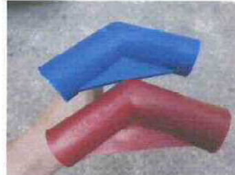
桁パイプ (軒部分) (青、赤コネクター付) (コネクターにGABLE・LEGの文字)