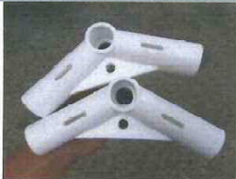
棟パイプ (頂上部分) (白コネクター付)