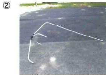
② 組み立てがしにくい場合は横にした状態で組み立てをしてください。