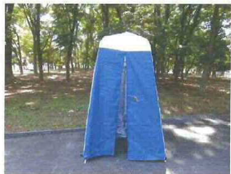
生地の位置を整え十分に引き下げます。