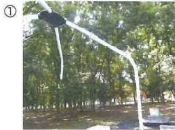
① 曲げパイプに柱パイプを差し込みます。