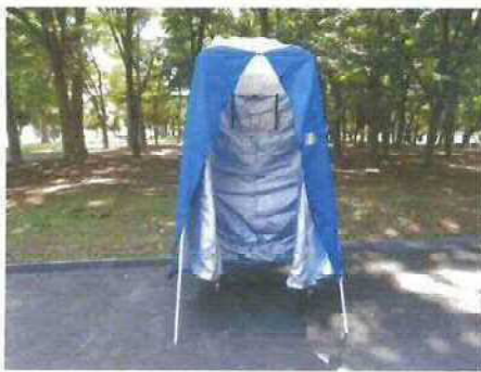
生地ファスナーを開いて被せます