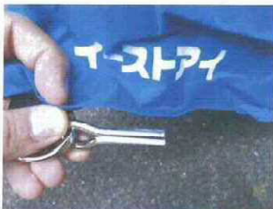
生地四隅のリングの先にある金属棒を折り返すようにしてパイプの中に差し込みます