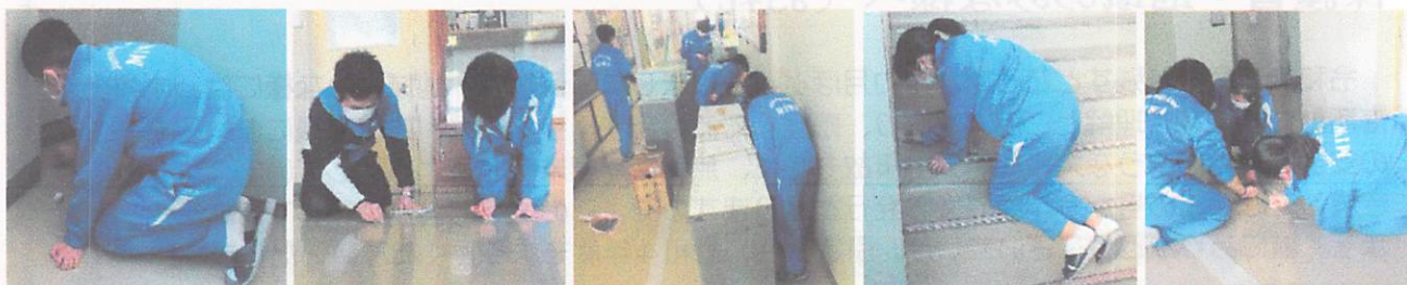
廊下の細かい汚れも、入り組んだ壁際も、ロッカーの裏側も、心を込めてきれいにしてくれました。まさに“立つ鳥跡を濁さず”！

「立つ鳥跡を濁さず」どころか、「来た時（入学時）よりも美しく」（←遠足の時によく使われる合言葉）といった感じで、 学校中が大変美しくなりました。3年生のみなさん、ありがとうございます！